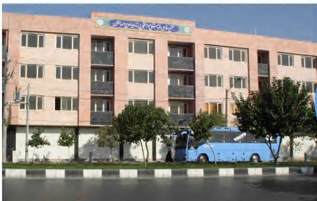
مجتمع خوابگاهی زنده یاد حاج احمد ناظران

طبق دستورالعمل ستاد کرونا ملاک پذیرش میهمانان محترم در خوابگاه‌ها تزریق ۲ دوز واکسن می باشد.